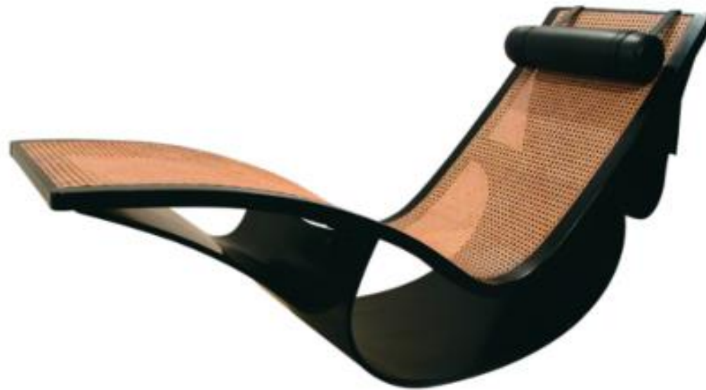
Espriguiçadeira, de Oscar Niemeyer